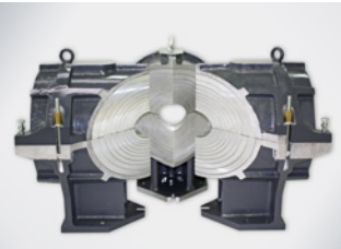
Spannwerkzeug T- / X-Stück