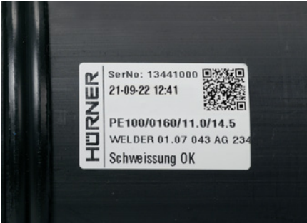
Etikettendrucker und Etikett

Zur direkten Qualitätsmarkierung für jede Schweißnaht kann mit einem speziellen, optionalen Etikettendrucker eine abriebfeste Kunststoffolie zur Formteilkennzeichnung bedruckt werden.