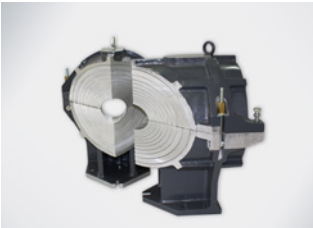
Spannwerkzeug Y-Stück (60°)