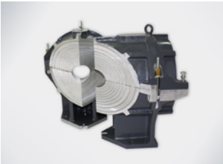
Spannwerkzeug Y-Stück (60°)