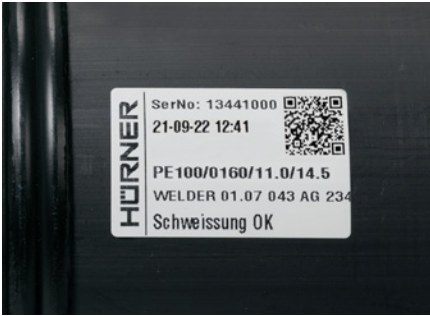
Etikettendrucker und Etikett

Zur direkten Qualitätsmarkierung für jede Schweißnaht kann mit einem speziellen, optionalen Etikettendrucker eine abriebfeste Kunststoffolie zur Formteilkennzeichnung bedruckt werden.